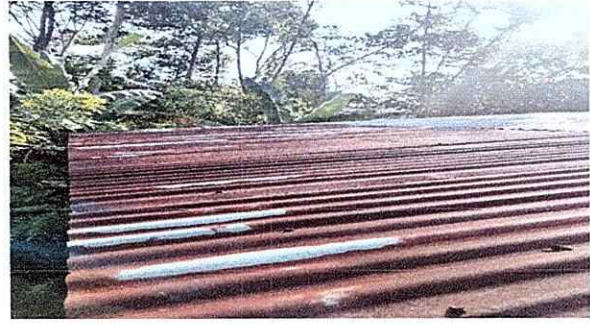
Foto 4: TECHO DEL ESTABLECIMIENTO en algunas partes tienen agujeros, dificultando el desarrollo de aprendizaje.