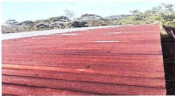
Foto 3: TECHO ACTUAL DEL ESTABLECIMIENTO se cambiará por completo el techo del centro educativo.