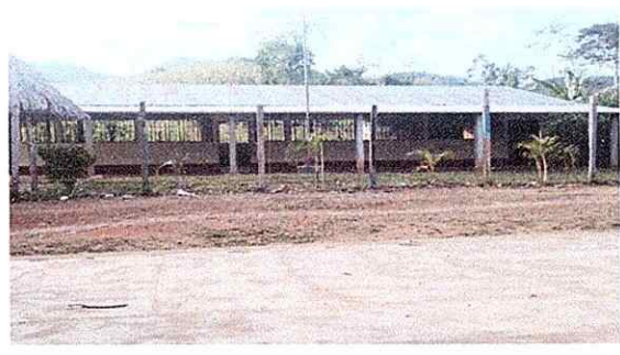
Foto 6: POSTES TIPO MADERA algunos de los postes ya no están en buen estado, al igual que la malla en algunos tramos ya no se encuentran.

Observación: Si es necesario se pueden agregar hojas adicionales y actualizar el número de hojas.