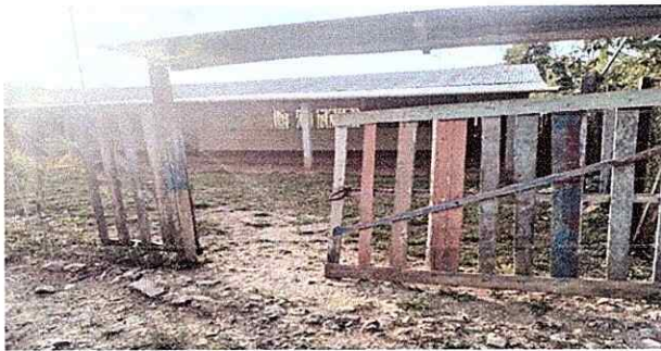
Foto 5: SITUACIÓN ACTUAL DE PUERTA DE ENTRADA la entrada principal ya no está en buen estado, es necesario cambiarlo.