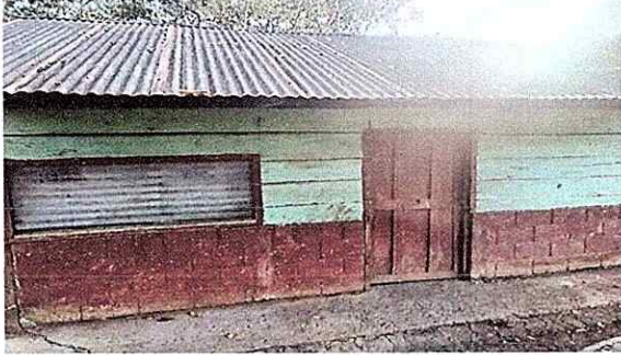
Foto 1: COCINA, se cambiará el techo y la pared; respetando las medidas que aparecen en el croquis.